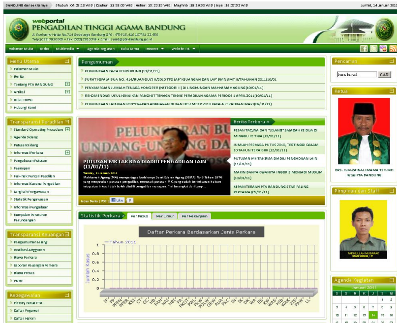
GAMBAR 5.13 FRONT-END WEB-PORTAL PENGADILAN TINGGI AGAMA BANDUNG